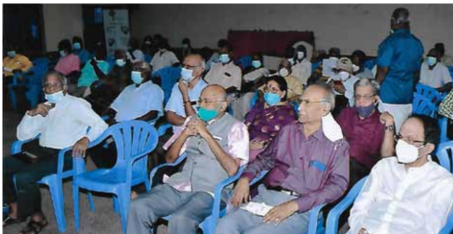
A view of the Audience.