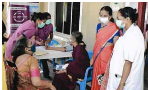
Health Monitoring by Geri Care Hospital, T. Nagar.