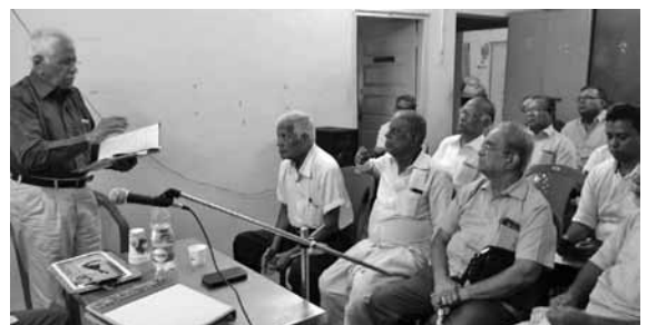
In the above photograph, he was occupying the front row and actively participating in a meeting organised by ‘FOSCATAN’ Chennai.