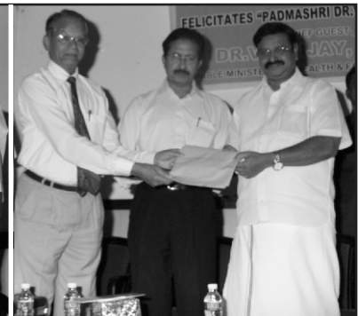
Chairman presenting the cheque to Hon'ble Minister