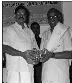
Hon'ble Minister Honoured Padmasri Dr. VSN