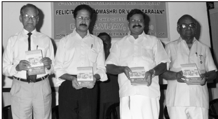
Hon'ble Minister releasing the Book "Doctors in Help"